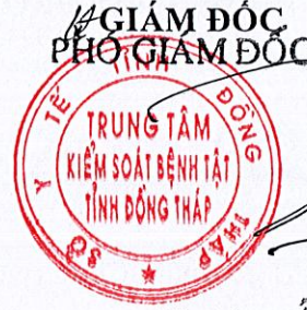
Dương Ân Hận