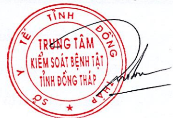
Dương Ân Hận