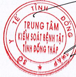
Dương Ân Hận