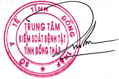
Dương Ân Hận